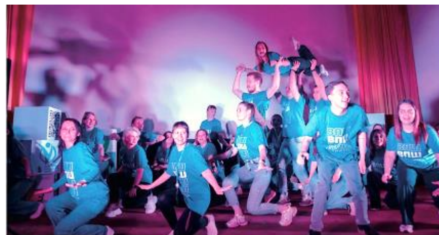
Музыка нас связала